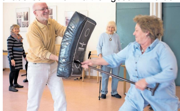
die hilfreich sein können